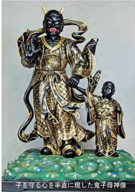
子を守る心を率直に現した鬼子母神像

ホームページ http://senjyuin.info/ E-mail: senjyuin@juno.ocn.ne.jp