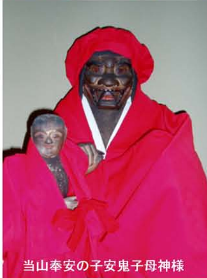
当山奉安の子安鬼子母神様

鬼子母神様は祈りの神です。祈りとは口先だけのものではなくてはなりません。真剣に心から祈らなければ鬼子母神様は認めません。ご利益だけ欲しいなどという身勝手な祈りでは通じないのです。祈ったら出来ることを行うことが大事です。その姿が美しいのです。